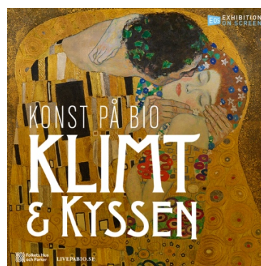
Filmaffisch Klimt & kysen med motiv Gustav Klimt: Kysen (beskuren), 1908