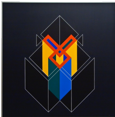
Cajsa Holmstrand: Utan titel, 1984