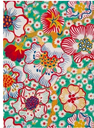
Josef Frank: Tapet Eldblomma, 1947 Norrköpings tapetfabrik