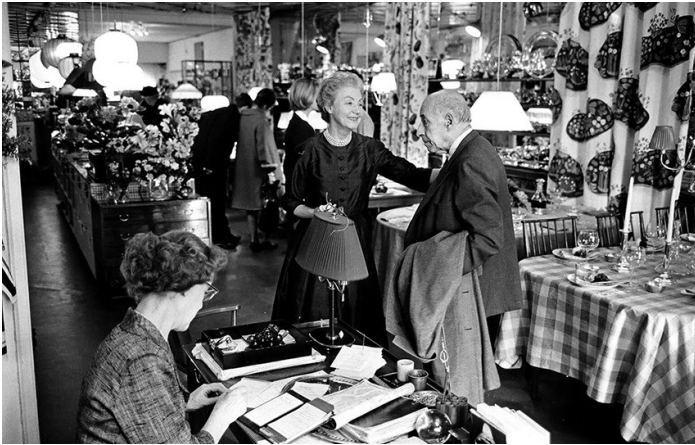
Estrid Ericson och Josef Frank i Svenskt Tenn.

Vid avbokning senare än en vecka före bokad visning återbetalas ej deltagaravgiften