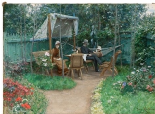
Johan Krouthén: Trädgårdsinteriör från Linköping, 1888

Vid avbokning fram till och med 5/5 återbetalas halva avgiften.