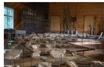
Från Lars Kleens ateljé: Flod, 2023

Onsdag 31/5 kl 18.00 i galleri 4 och 5: Onsdagsklubb.