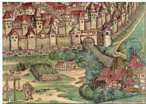
Illustration i Nürnbergkrönikan av Hartmann Schedel, 1493