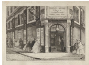
A M Poatémont: Etsarsällskapets säte, 1864